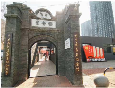
中共满洲省委旧址纪念馆现状。

《中共满洲省委旧址》用厚重的笔墨、典雅的色彩构建出中共满洲省委旧址的庄严肃穆,描绘了人们在参观时的各种情态;孩子目光中闪烁着崇敬,老人目光中含藏着回味。