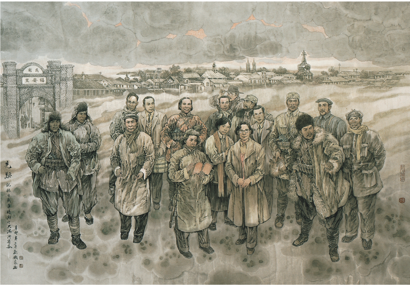
《中共满洲省委》国画 刘铁泉