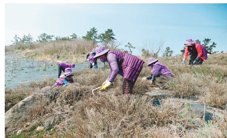
3月8日,身着紫色服装的居民在韩国新安郡半月岛上的薰衣草田里劳作。位于韩国新安郡的半月岛因遍布紫色建筑和花草而吸引众多游客。该岛最初的紫色来自土生土长的紫色铃兰花,当地政府为促进旅游从2015年开始打造紫色小岛。