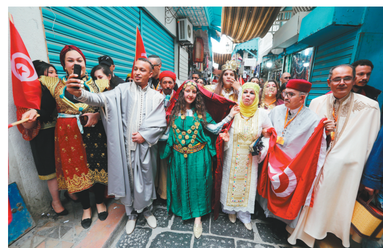
3月14日,人们在突尼斯首都突尼斯市身着传统服饰参加庆祝活动。当日,突尼斯举行“传统服饰日”庆祝活动。