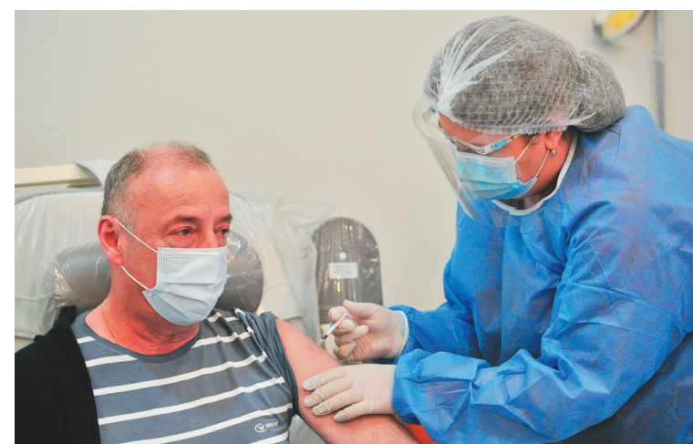
3月15日,一名医务人员在格鲁吉亚第比利斯接种新冠疫苗。当日,格鲁吉亚正式启动全国新冠疫苗接种工作。根据该国接种计划,一线医务人员将首先接种。