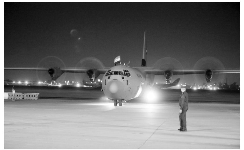
3月2日,装载中国援助的新冠疫苗的飞机抵达伊拉克巴格达的空军基地。中国援助伊拉克的首批国产新冠疫苗2日运抵巴格达。