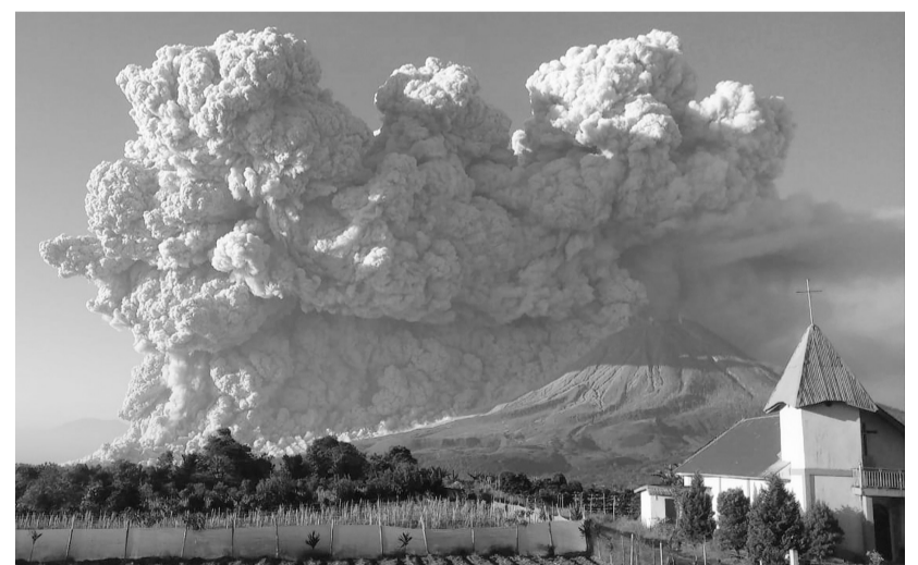
3月2日在印度尼西亚北苏门答腊省卡罗拍摄的喷发的锡纳朋火山。