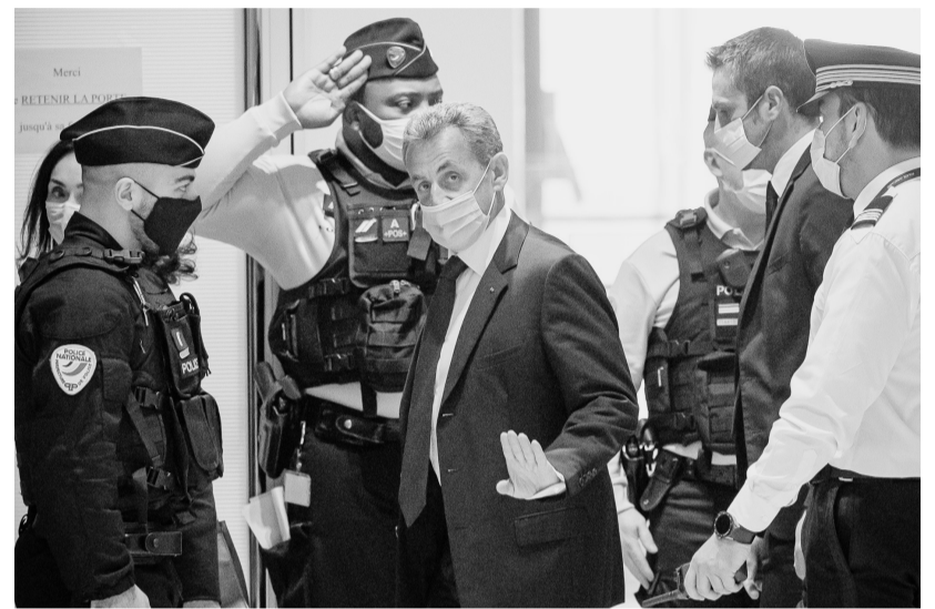
3月1日,法国前总统萨科齐(中)抵达巴黎一家法院。据法国媒体1日报道,法国巴黎轻罪法院当天裁定前总统萨科齐“腐败”和“以权谋私”罪名成立,判处其3年有期徒刑,其中包括1年实刑。