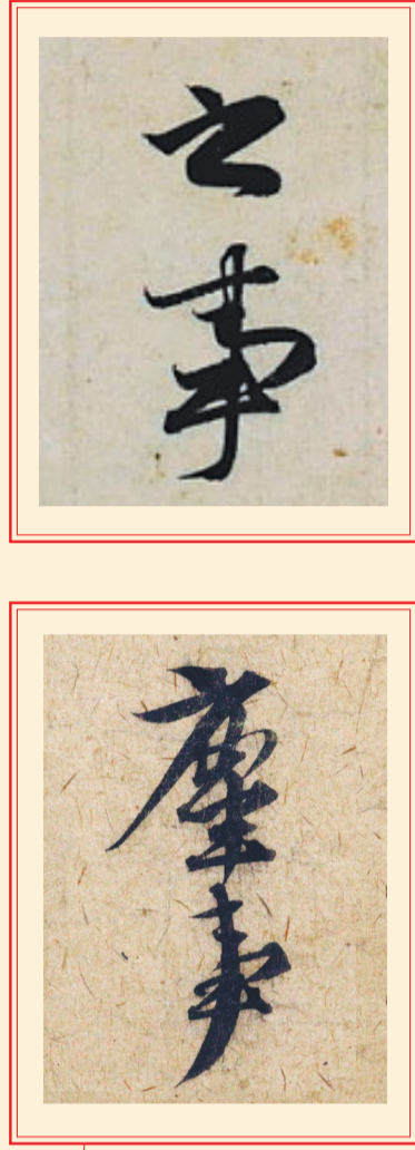
左为赵孟頫书《奉别帖》局部，可与《归来辞》《秋声赋》对比欣赏