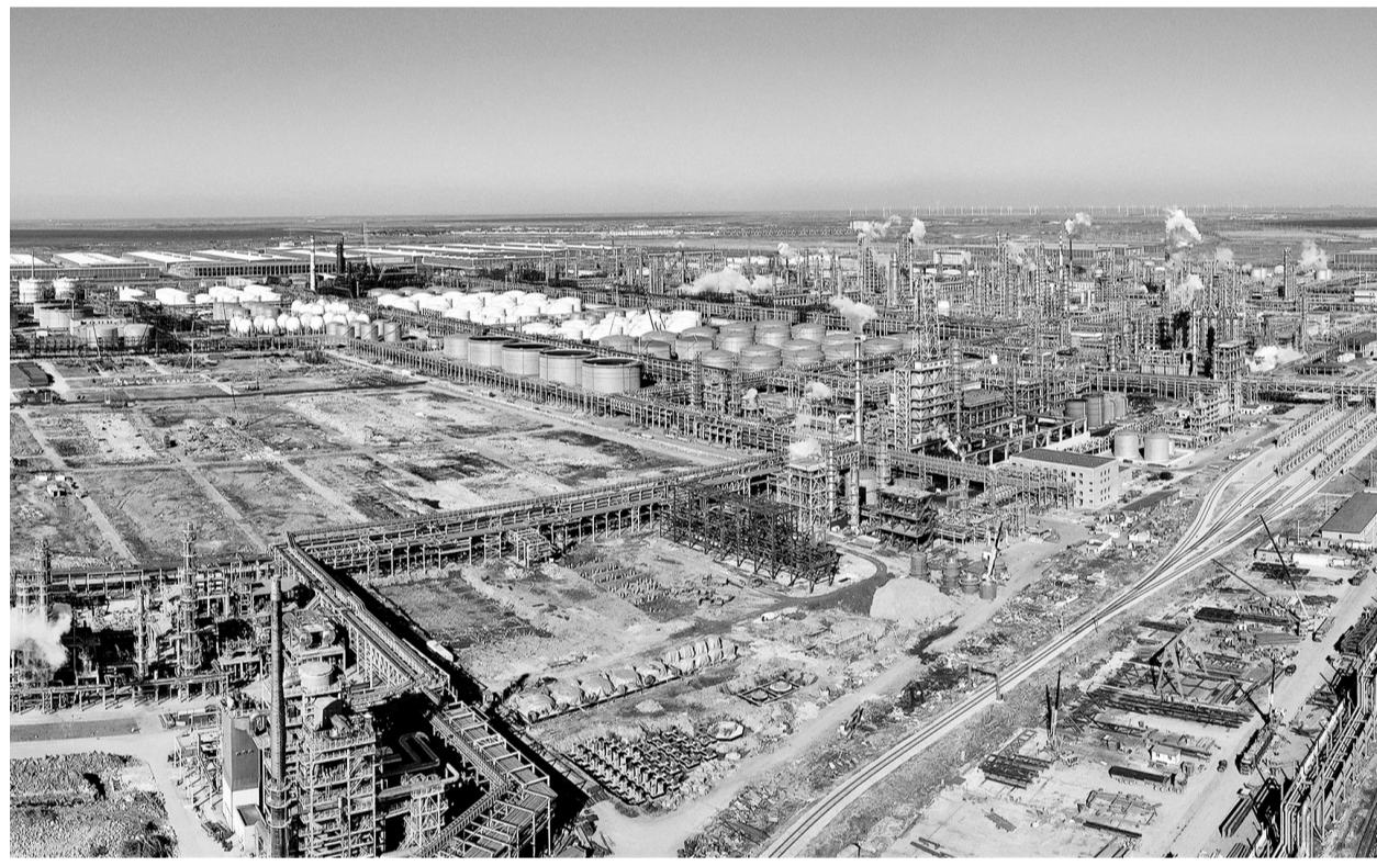
开年以来,盘锦市坚持“项目为王”理念,积极做好企业复工复产保障和服务工作,全力推进北方华锦联合石化有限公司1500万吨/年炼油、150万吨/年乙烯及系列精细化工产品生产装置等施工建设,为全市工业经济平稳增长积蓄新动能、带来新活力。一批重点项目的实施,更为加快盘锦世界级石化及精细化工产业基地建设提供了有力支撑。图为盘锦北方沥青燃料有限公司施工现场。