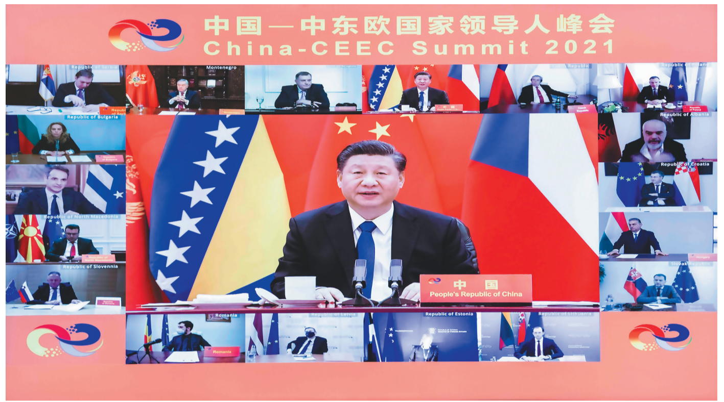
2月9日,国家主席习近平在北京以视频方式主持中国—中东欧国家领导人峰会,并发表题为《凝心聚力,继往开来 携手共谱合作新篇章》的主旨讲话。

新华社北京2月9日电 国家主席习近平9日在北京以视频方式主持中国—中东欧国家领导人峰会,波黑、捷克、黑山、波兰、塞尔维亚、阿尔巴尼亚、克罗地亚、希腊、匈牙利、北马其顿、斯洛伐克、保加利亚、斯洛文尼亚、爱沙尼亚、拉脱维亚、立陶宛、罗马尼亚等中东欧国家元首、政府首脑和高级别代表出席。习近平发表题为《凝心聚力,继往开来 携手共谱合作新篇章》的主旨讲话。习近平强调,中国—中东欧国家合作坚持共商共建、务实均衡、开放包容、创新进取,是多边主义的生动实践,是中欧关系的重要组成部分。中国愿同中东欧国家顺应时代大势,实现更高水平的共同发展和互利共赢,携手推动构建人类命运共同体。 习近平在讲话中指出,中国—中东欧国家合作已经走过9年历程。9年来,中国—中东欧国家合作经历了时间和国际形势复杂变化的考验,形成了符合自身特点并为各方所接受的合作原则。