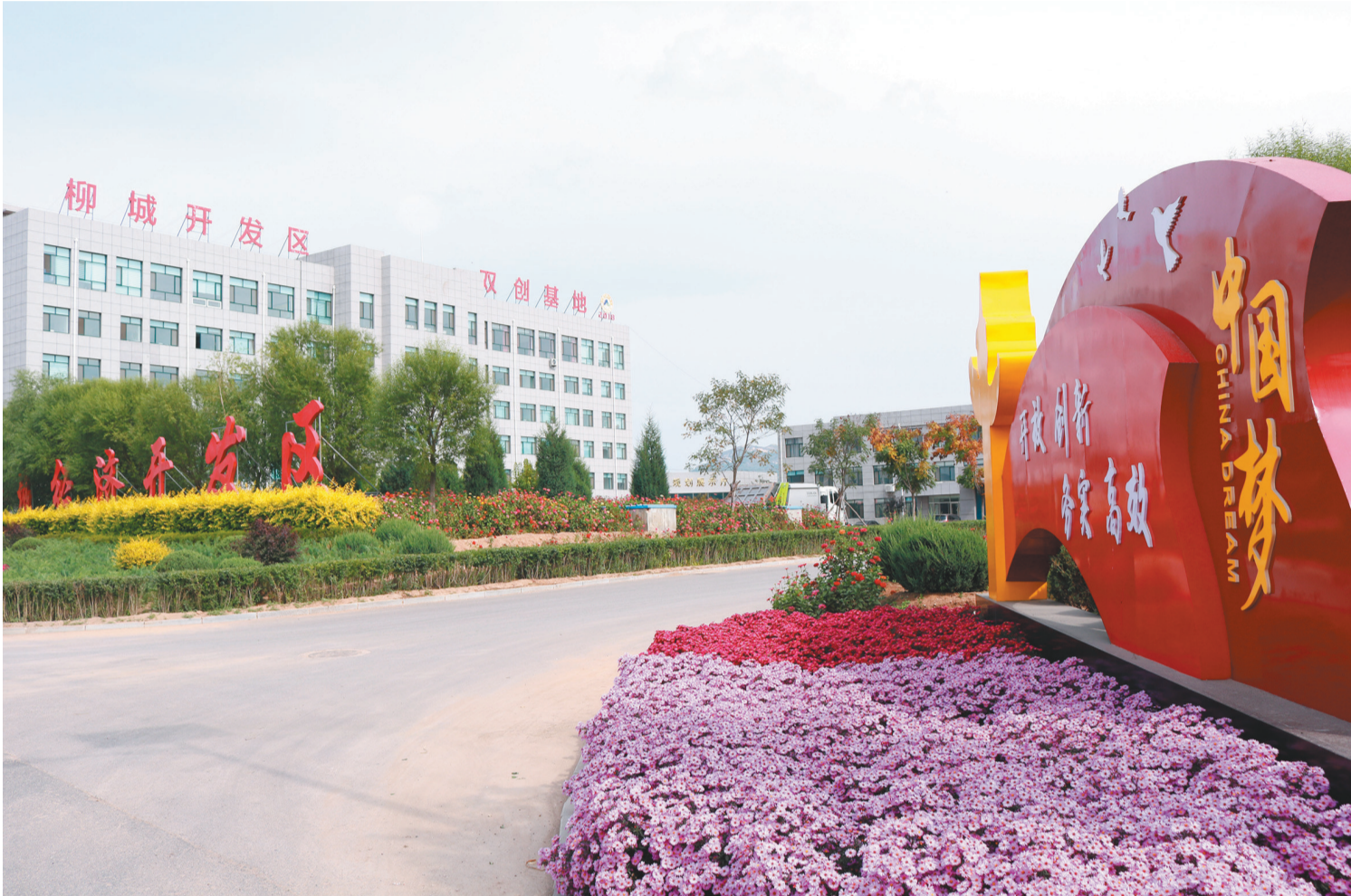
环境优美的朝阳柳城经济开发区。(资料片)

朝阳柳城经济开发区思路清晰、目标明确:迈入新发展阶段,以推动高质量发展为主题,以优化营商环境为突破口,以京津冀招商为主抓手,进一步加大建设力度,开发区干劲十足、目标坚定、勇毅笃行,奋力开创经济社会高质量发展新局面。