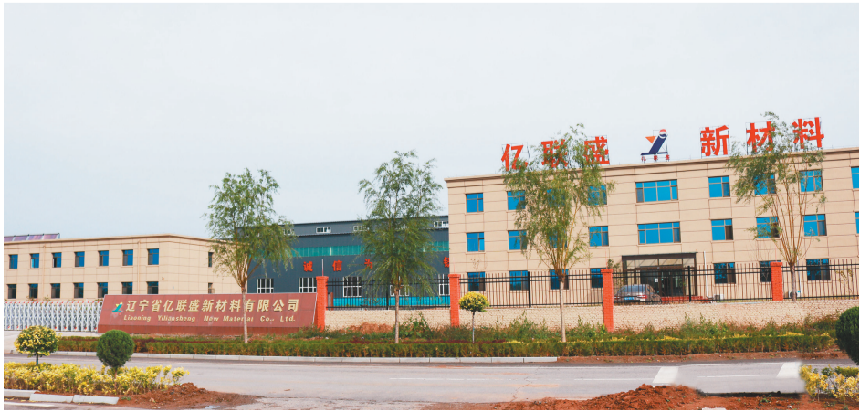
辽宁亿联盛新材料有限公司生产的高速钢轧辊产品畅销国内。(资料片)