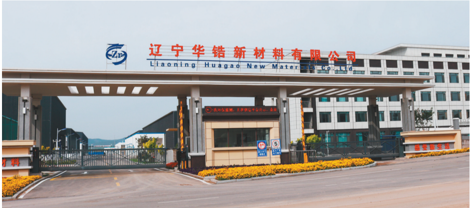
辽宁华锆新材料有限公司主产的工业级海绵锆,用于核电、航空航天、海洋工程等领域。(资料片)