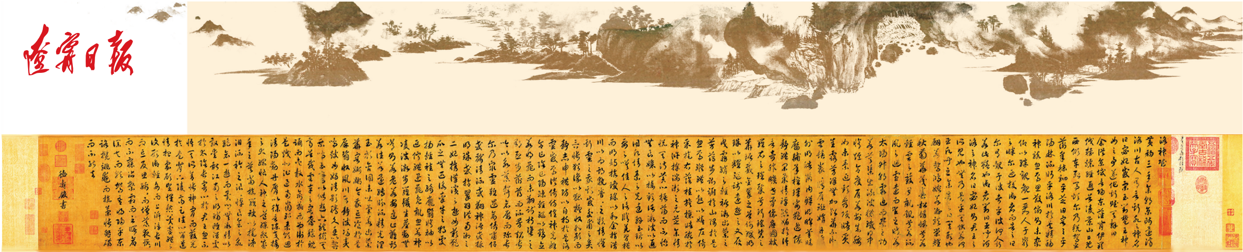
宋高宗赵构草书《洛神赋》。