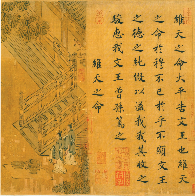
宋高宗赵构的楷书。

皇的瘦金体，并未领受所谓的“横向取法”“地域书风”的拘碍，他唯汲古幽邃，朝乾夕惕，亦步亦趋地尊古奉行，舒展中和之美，“不激不厉，风规自远”。历代草书家，本应具草书性格，心如止水，动若脱兔。作为书法大家，在硝烟纷起泰山崩于前时，赵构尚可宁静雅宜地书写，惯习性、习气兼才情所