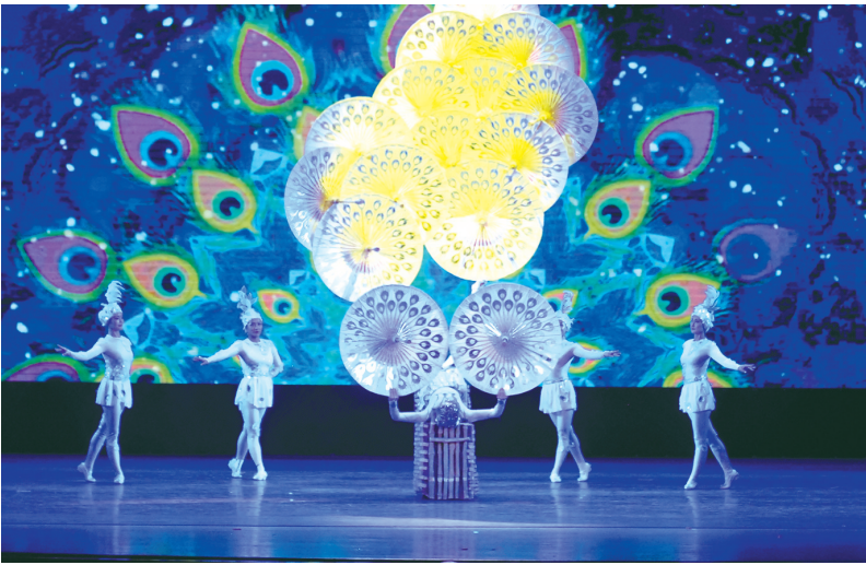
杂技剧《胡桃夹子》剧照。