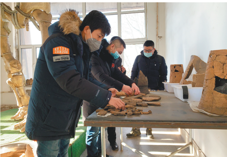
公众考古实践活动现场。

在阜新市博物馆举办的“他尺西沟遗址”主题文物展览中,公众观展可以全面了解3年来遗址的发掘情况,从图片上可以看到考古工地的现场、遗迹的分布,发掘的经过;听专家