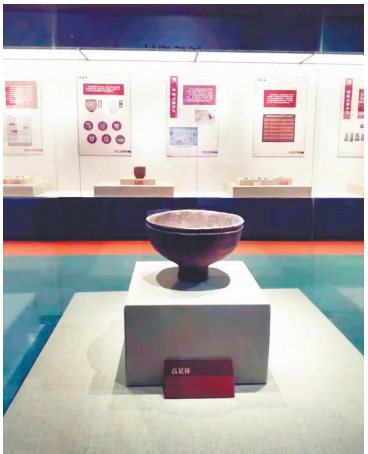
“辽河畔史前文明之花——沈阳新乐遗址展”展览现场。

新乐遗址的发现,填补了辽河流域中下游地区新石器时代文化的空白,并把沈阳地区有人类活动的历史从原来的5000年前推到7000年前,其独特的文化内涵在史学界被命名为“新乐文化”,具有较高的历史价值、科学价值和独特的文化艺术价值。