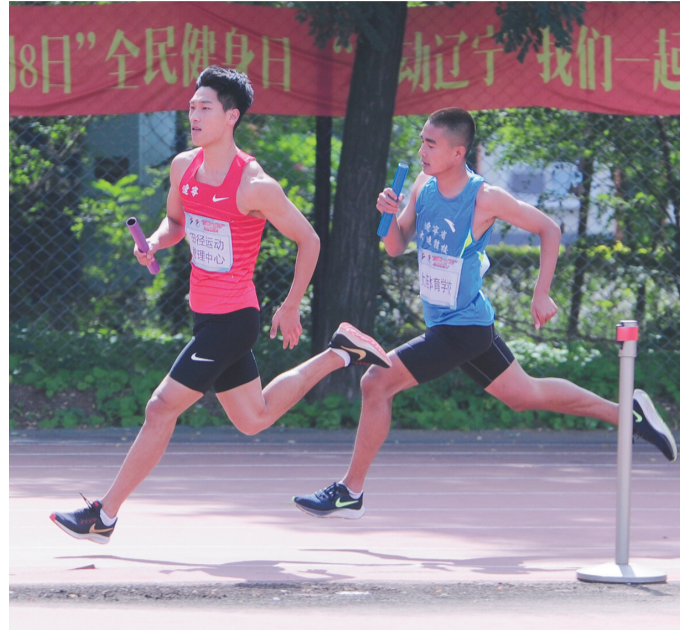
9月23日,我省运动员进行接力项目体能测试。