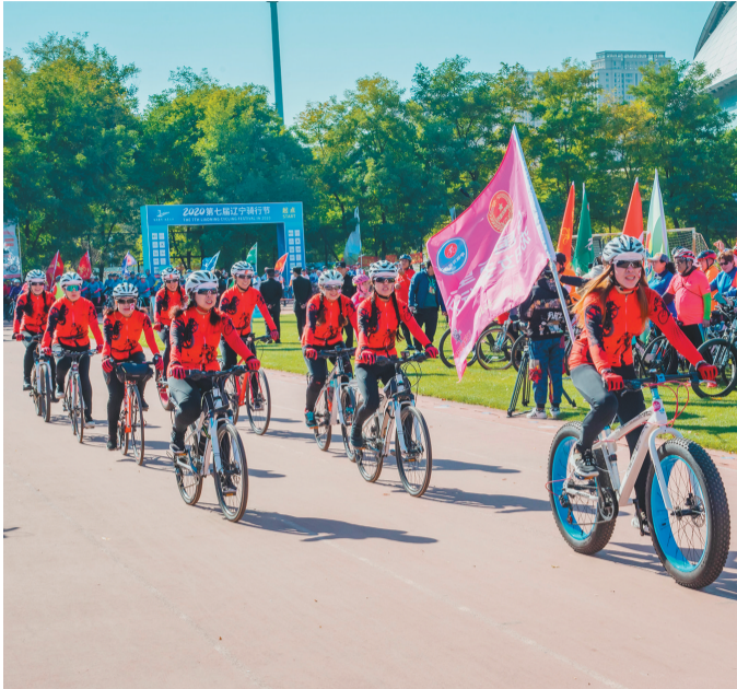
10月18日,第七届辽宁骑行节开幕,众骑手出发。