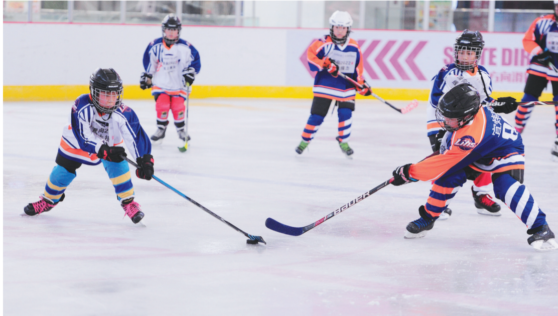
4月20日,2020年“运动辽宁”青少年冰球挑战赛场景。