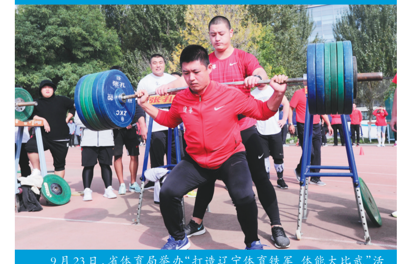
9月23日,省体育局举办“打造辽宁体育铁军 体能大比武”活动,参赛选手进行负重深蹲比拼。

在此之前,辽宁出台《体育领域供给侧结构性改革实施方案》,规划了“一带、二路、三核、九区”的体育产业发展布局,推出了119个重点体育产业发展项目,提出到2025年实现2000亿元目标。