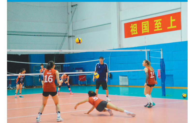
辽宁女排备战于11月12日揭幕的中国女排超级联赛。

值得一提的是,受疫情等因素影响,第十四届全国冬季运动会延期举行。我省共有181名运动员征战十四冬,参加全部7个大项15个分项的比赛,参赛人数和项目数排在全国前列。在已经结束的十四冬先期决赛中,辽宁运动员共获得6枚金牌、9枚银牌、5枚铜牌,金牌数和奖牌数排名全国第五。