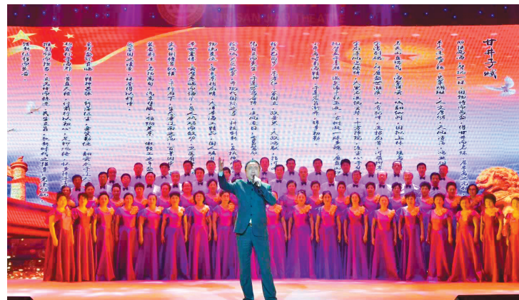
演员在晚上朗诵《甘井子赋》。

精美文化礼品。将《甘井子赋》篆刻于竹筒之上,并附之以专题宣传片二维码、全景VR展示