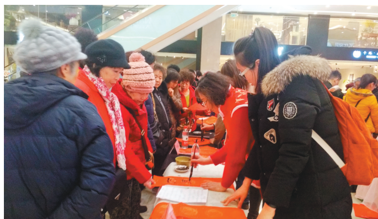
书法家为甘井子区群众书写春联。(资料片)