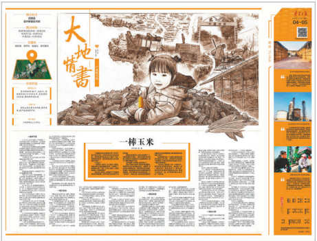
第二封情书《一棒玉米》。