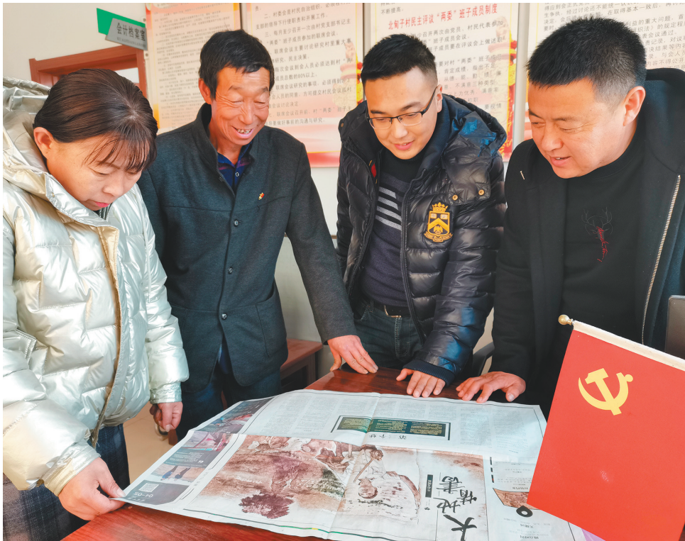
彰武县北甸子村党员干部共同阅读《大地情书》。