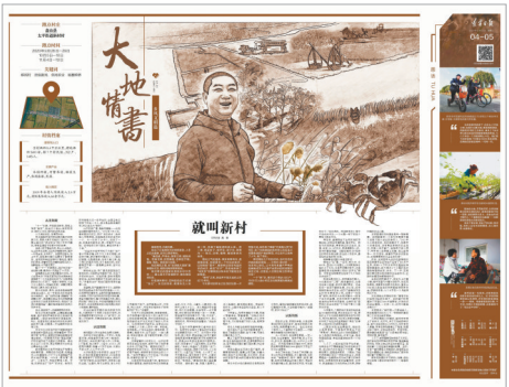
第三封情书《就叫新村》。