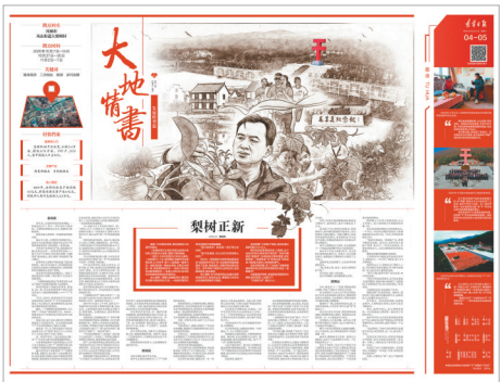
第一封情书《梨树正新》。

稿件及纪录片在五个村及所在县、市反响尤为强烈,阜新日报决定全文转发《第三个梦》,盘锦发布、铁岭党建、彰武融媒等多个市县的官微在第一时间推送相关稿件,彰武县委宣传部还安排全县宣传委员及乡镇、村级网格员对报道进行转发、传阅,《大地情书》的影响不断扩大。