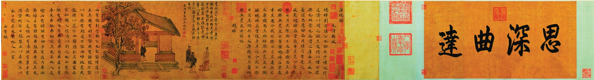
宋高宗赵构书、马和之画《毛诗唐风图》（部分）。