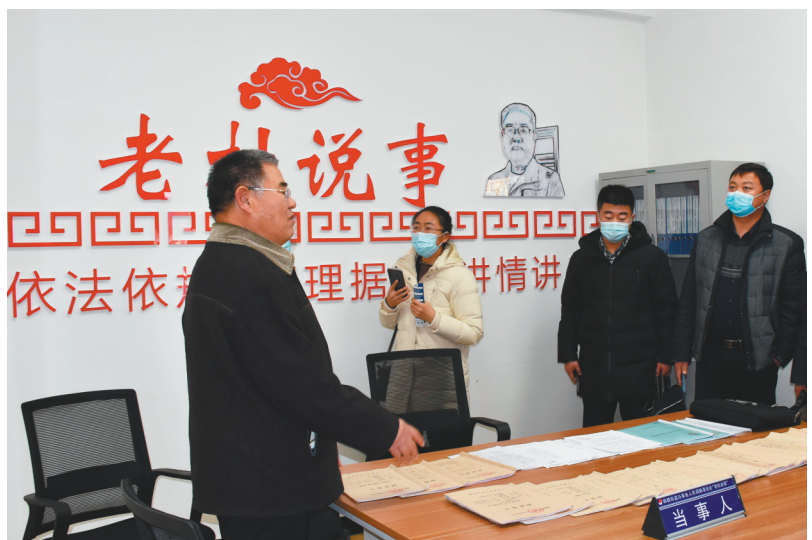
大石桥市钢都街道“老林说事”工作室内,老党员在调解纠纷。

村(社区)党群服务中心则以“一室多用”为原则,抓好“1+4+X”若干功能室,不断拓展和完善基础服务功能,实现小事不出村,问题零积存。