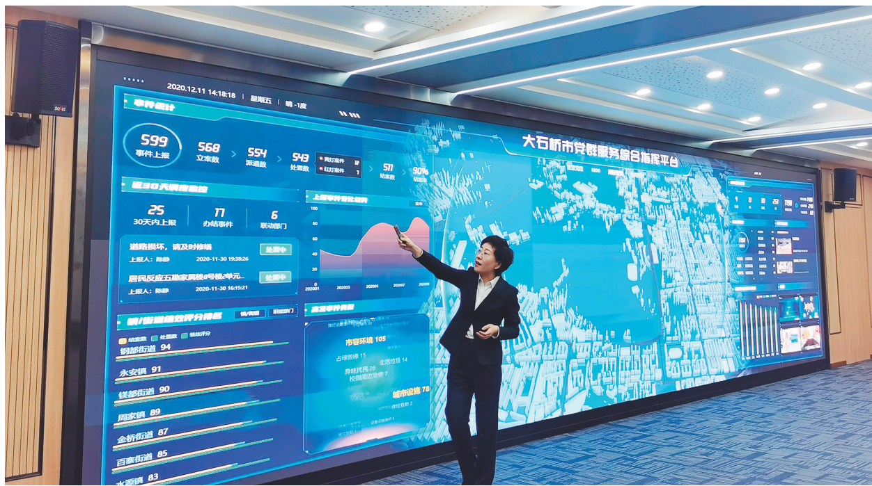
大石桥市党群服务综合指挥平台。

整合线上线下资源,简化服务流程。大石桥市设计研发以“智慧党建、8890、网格管理、便民服务”为主体的党群服务综合指挥系统,搭建市(县)、乡镇(街道)、村(社区)三级指挥处置平台和三级便民服务阵地,通过统一指挥、多方响应、智能分派、快速反馈等全流程、闭环式运行机制,实现一网指挥、一网治理、一网服务。