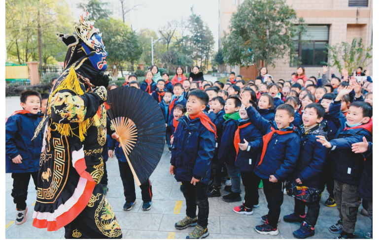
12月22日,孩子们在观看变脸表演。当日,安徽省合肥市朝霞小学开展非遗进校园活动,邀请变脸、皮影戏、蛋雕、糖画等非物质文化遗产传承人来到校园进行展示,让孩子们近距离接触民间传统技艺。