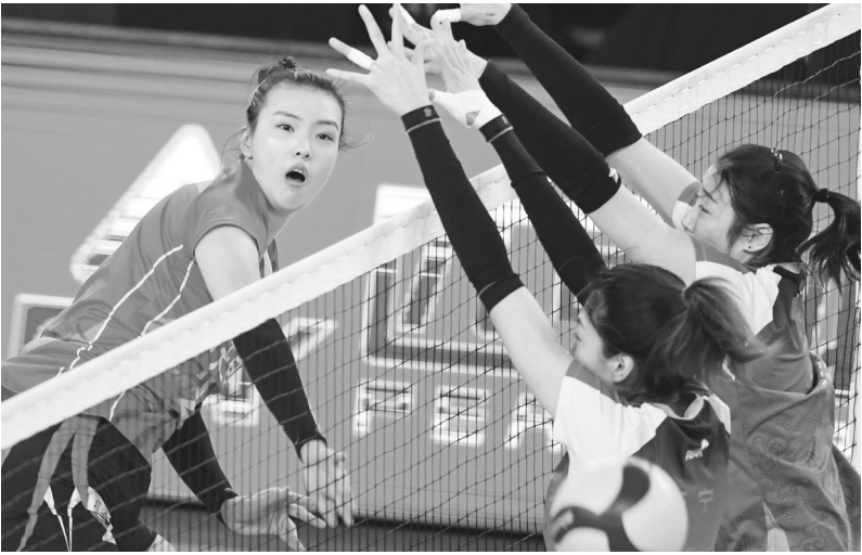
12 月 16 日,江苏队球员张常宁(左)在比赛中扣球。

本报讯 记者黄岩报道 12 月 16 日,2020—2021 中国女排超级联赛迎来了冠军总决赛,由天津女排对阵江苏女排。比赛采用 3 场 2 胜的赛制,在双方的第一场比赛中,江苏女排以 3:1 获胜。 虽然今年女排联赛走到最后的是两支全华班队伍,但天津女排由朱婷和李盈莹领衔,江苏队则有张常宁和龚翔宇坐镇,集齐中国女排的现役四大主攻手,也注定了这轮