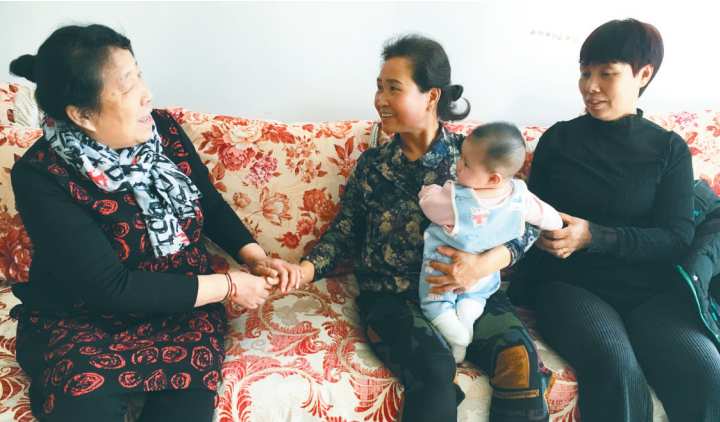
铁岭县石山子村姐妹调解团成员到村民家走访。