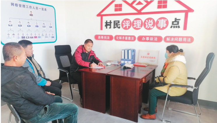
铁岭县汤牛堡子村村民到评理说事点调解矛盾纠纷。

今年，铁岭县作为“党群一张网、服务叫得响”全省试点县之一，在完善社会治理体制方面进行了积极探索。通过坚持以党建为引领，以服务为切入点，构建一网多能、三级联动、“五治”融合的治理格局，探索出一条符合县情实际的基层社会治理之路，县域治理水平不断提高，群众满意度明显提升。