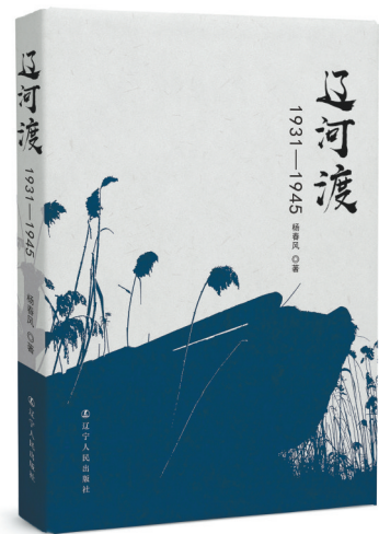
2020年我省具有影响力的部分作品封面。