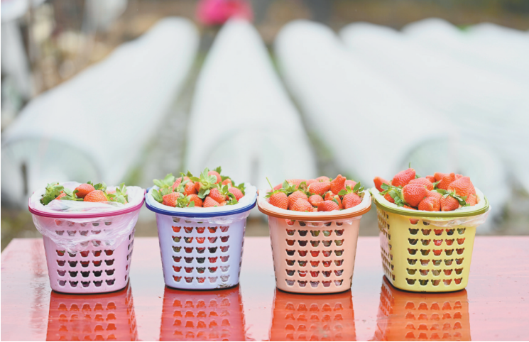
这是广西柳州市柳江区进德镇泗浪村草莓园新上市的草莓(12月13日报)。近期，广西柳州市柳江区进德镇各草莓园陆续开园，吸引游客前来享受采摘乐趣。近年来，柳州市柳江区加快农业结构调整，积极发展果蔬种植产业，拓宽农民增收渠道。