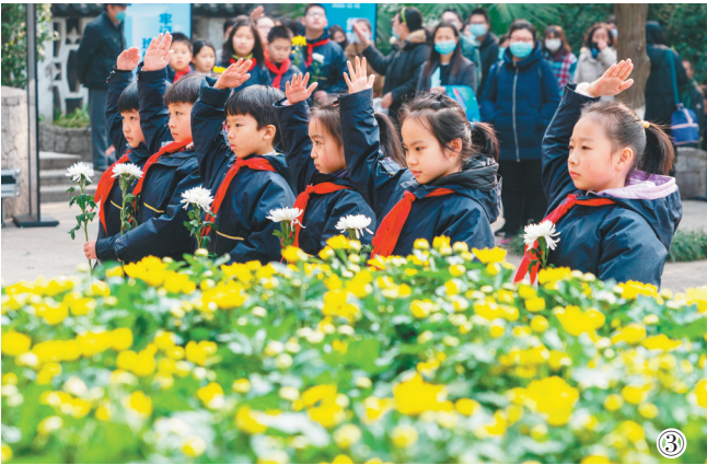
图①②:12月13日拍摄的南京大屠杀死难者国家公祭仪式现场。图③:12月13日，少先队员在侵华日军南京大屠杀北极阁丛葬地遇难同胞纪念碑前敬少先队礼。当日是第七个南京大屠杀死难者国家公祭日，南京大屠杀死难者国家公祭仪式在侵华日军南京大屠杀遇难同胞纪念馆举行。南京市民通过默哀、献花等多种形式悼念遇难同胞，宣示中国人民铭记历史、不忘过去，珍爱和平的庄严立场。