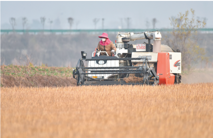
12月12日，在安徽省巢湖市槐林镇南大圩，农民驾驶收割机在稻田里收割晚稻。近期，安徽巢湖天气晴好，农民趁着晴好天气抓紧收割晚稻，确保颗粒归仓。