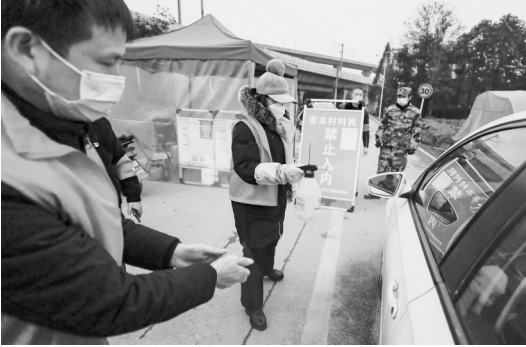
在太平村一路口,村民志愿者给车辆消毒。