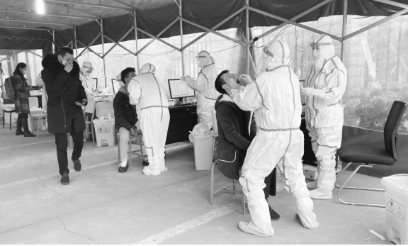
在成都市第一人民医院,核酸检测工作有序进行。