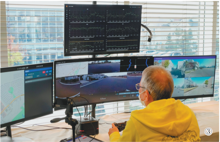
图①②：12月9日在日本神奈川县藤泽市拍摄的送货机器人。 图③：12月9日，在日本神奈川县藤泽市，一名工作人员通过远程系统控制送货机器人。 日本松下公司7日宣布将于明年2月份对新推出

的一款送货机器人进行试用。该款机器人最高速度约每小时4公里，通过远程控制运送货物。使用这款“快递小哥”机器人送货，可有效减少疫情期间的人际接触。