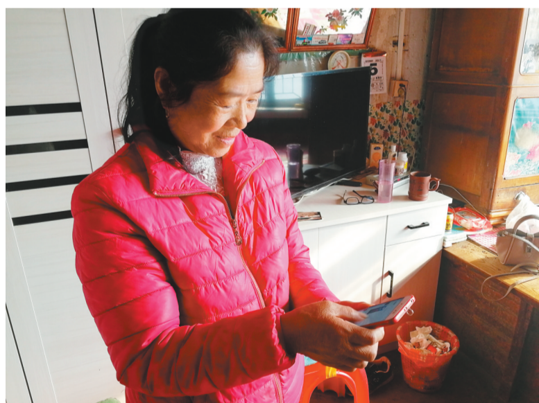
柏军母亲在看柏军生前的微信。