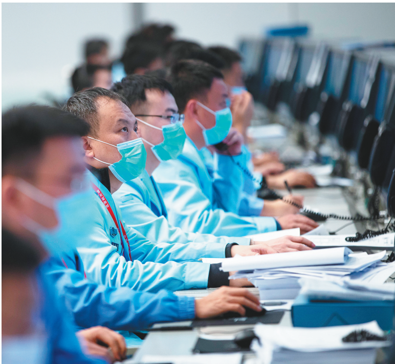
12月6日,航天科技人员在北京航天飞行控制中心指挥大厅监测嫦娥五号上升器与轨道器返回器组合体交会对接情况。

核心提示 12月6日凌晨,嫦娥五号上升器成功与轨道器返回器组合体交会对接,并将月球样品容器安全转移至返回器中。这是我国航天器首次实现月球轨道交会对接。