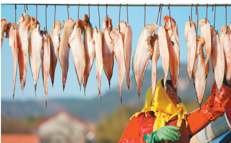
12月6日,即墨区鳌山卫街道珠石村渔民在晾晒鱼干。入冬以来,山东省青岛市即墨区沿海一带的渔民抓住晴好天气,忙着将捕获的鲈鱼、偏口鱼、鳗鱼等20余种海鱼进行切割、腌制、晾晒,加工成鱼干。