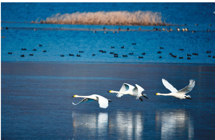
2月6日,天鹅在北京市怀柔区怀柔水库里飞翔。近日,大批迁徙的天鹅来到位于北京市怀柔区的怀柔水库,成为冬日里一道生态美景。