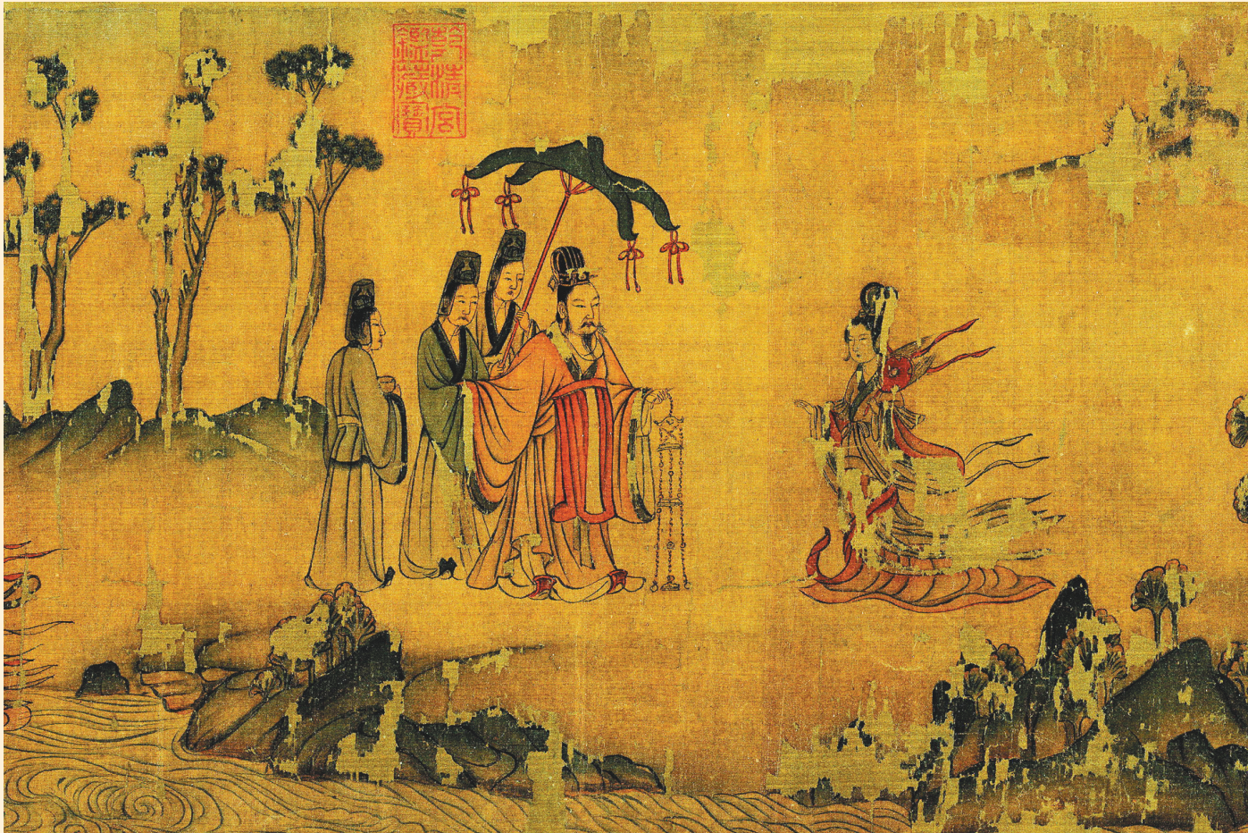
北宋佚名摹顾恺之《洛神赋图》 (局部细节) 绢本 设色 手卷 纵26.3厘米 横646.1厘米