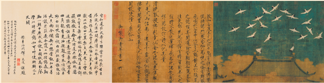
宋徽宗赵佶《瑞鹤图》 绢本 设色 手卷 纵51厘米 横138.2厘米 辽宁省博物馆藏

《瑞鹤图》是辽博最重要藏品之一，为赵佶30岁时所作。宋徽宗赵佶（1082年—1135年），宋神宗第十一子、哲宗弟。工书擅画，并创“瘦金体”，促进了宋代画院的建设 and 院体画的发展，是历史上艺术造诣超群的皇帝。