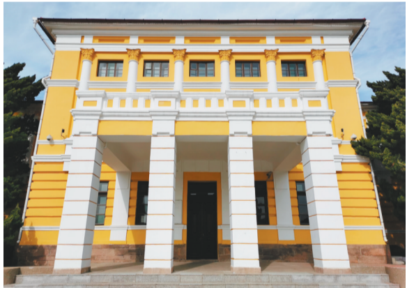
修缮后的关东军司令部旧址。