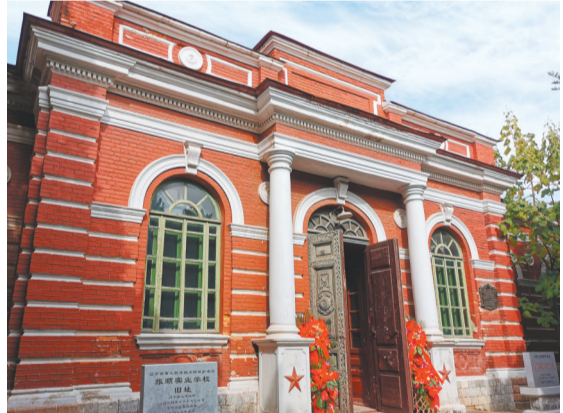
旅顺实业学校旧址。