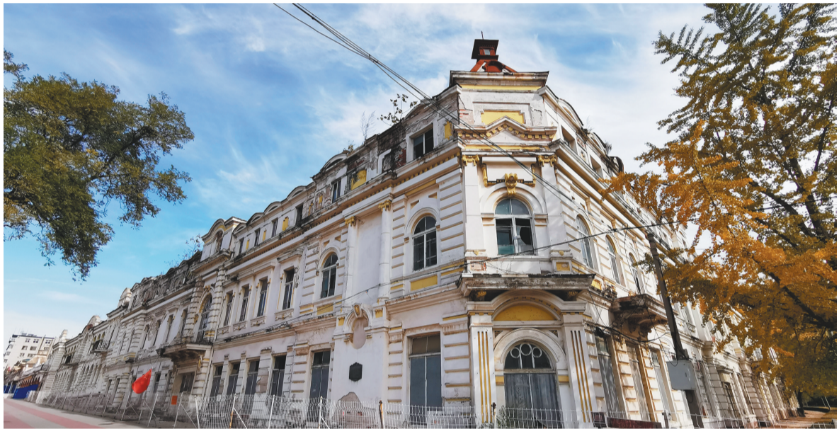
旅顺师范学堂旧址。

日俄战争后,日本进驻旅顺,太阳沟成了1.4万日本人的集中居住地。从1905年至1945年的40年中,日本侵略者在沙俄划定的城区基础上,进行了大规模、大范围的城市建设,但以民居居多。太阳沟现存的众多红砖日本房就是那个时期的产物。如此密集、年代如此久远的日本民居群,较为少见。