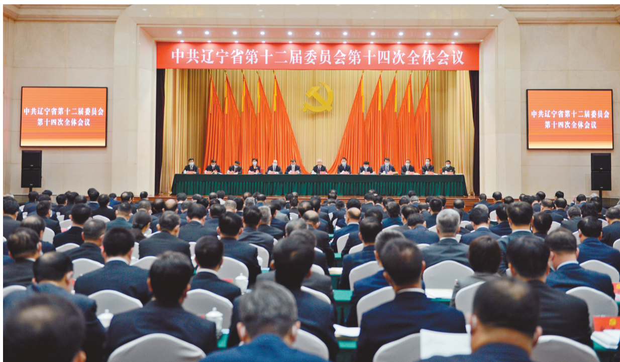
图为中共辽宁省委十二届十四次全会现场。

全会充分肯定辽宁“十三五”时期全面建成小康社会取得的决定性成就。一致认为,过去五年,面对纷繁复杂的国内外形势特别是新冠肺炎疫情严重冲击,在以习近平总书记为核心的党中央坚强领导下,省委不忘初心、牢记使命,团结带领全省广大党员干部群众,认真贯彻落实党中央决策部署,深入学习贯彻习近平总书记关于东北、辽宁振兴发展的重要讲话和指示精神,凝心聚力、迎难而上、奋力攻坚,扎实推进辽宁振兴发展各项事业。综合实力稳步提升,在主动做实经济数据的基础上,全省经济实现企稳回升;结构调整取得积极进展,供给侧结构性改革扎实推进,先进制造业不断壮大,粮食生产连年丰收,民营经济对