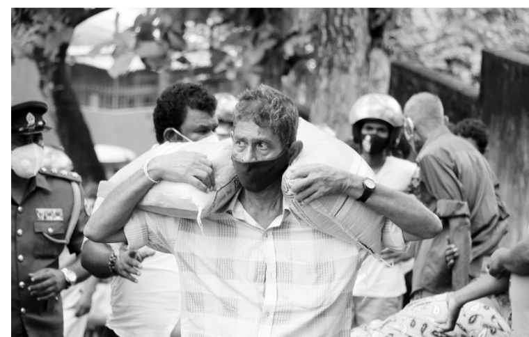
图为在斯里兰卡首都科伦坡,一名男子领取粮食。11月25日,科伦坡市议会向地处科伦坡市郊疫情“隔离区”内的市民发放免费粮食。为控制疫情蔓延,斯里兰卡警方从10月底开始将包括科伦坡在内的西部省划定为“隔离区”。为帮助在隔离区内生活受到影响的居民,科伦坡市议会决定向他们免费分发粮食。