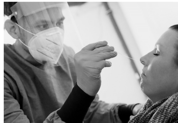
11月25日,一名女子在德国柏林接受新冠病毒检测取样。德国联邦和各州政府25日晚达成协议,延长从11月初开始实施的新冠防疫限制措施至12月20日,并进一步收紧私人聚会人数限制、戴口罩等相关规定。