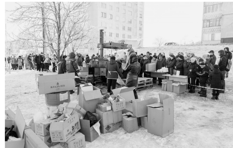
11月24日,市民在俄罗斯符拉迪沃斯托市的一个救助点领取食物。俄罗斯滨海边疆区近日因暴风雪进入紧急状态,符拉迪沃斯托市15万人面临断水断电。