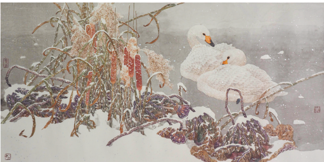
黄洪涛《清风》中国画