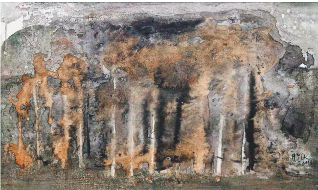
黄亚奇《秋韵》水彩(局部)