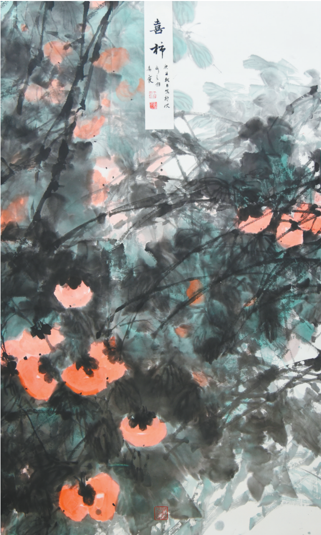
王易霓《喜柿》中国画

万弘巍的作品《北方·谷雨》,是描绘家乡农民实地劳动的一幅油画。每年谷雨时节,人们开始了一年的辛勤劳作,为小康生活而奋斗。作品采用灰色调,契合春天土地的颜色,笔触充满“泥土感”,表现农民对土地的热爱与眷恋。人物面露微笑,向往着新的丰收。拖拉机富力量感,与敦厚朴实的北方农民一样,都是广袤东北平原上的赤子,一道为美丽的梦想努力拼搏。