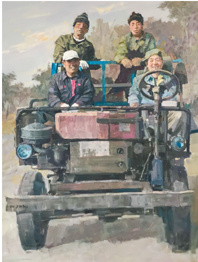
万弘巍《北方·谷雨》油画