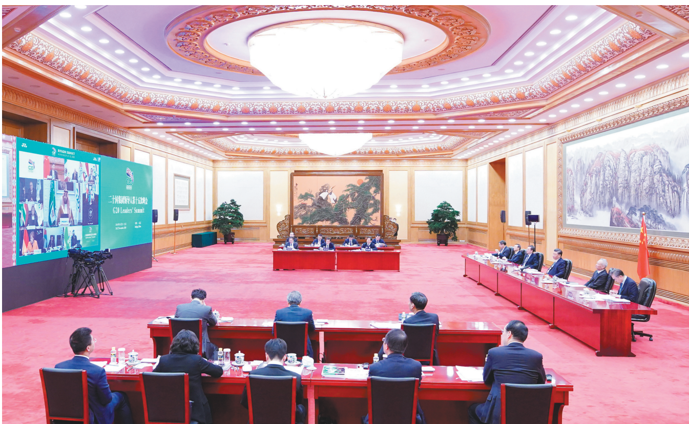
11月21日晚,国家主席习近平在北京以视频方式出席二十国集团领导人第十五次峰会第一阶段会议并发表重要讲话。

新华社北京11月21日电 国家主席习近平21日晚在北京以视频方式出席二十国集团领导人第十五次峰会第一阶段会议并发表题为《勠力战疫 共创未来》的重要讲话,强调二十国集团应该遵循共商共建共享原则,坚持多边主义、开放包容、互利合作、与时俱进,在后疫情时代国际秩序和全球治理方面发挥更大引领作用。中国愿同各国相互尊重、平等互利、和平共处、共同发展,共同推动构建人类命运共同体。