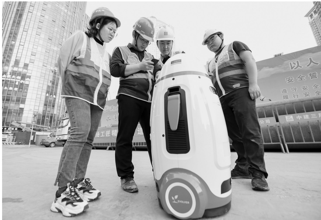
右图为11月17日,中建三局一公司的工程人员在调试操作智能安全教育机器人。