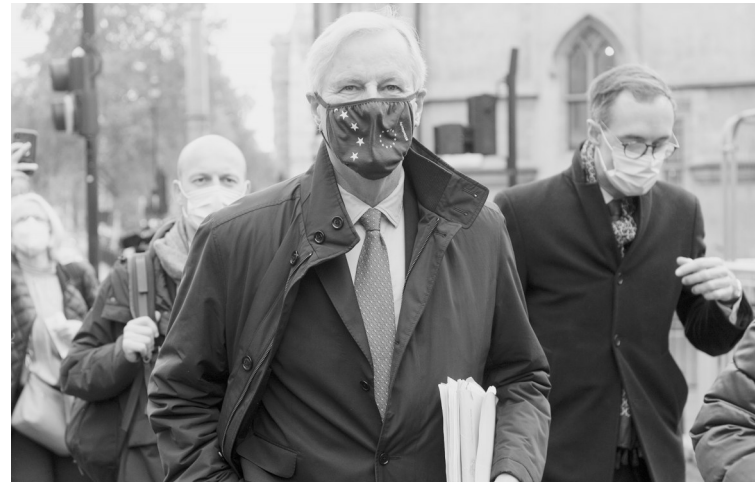
11月9日,在英国伦敦,欧盟首席谈判代表米歇尔·巴尼耶(前)前往与英方谈判的地点。英国首相约翰逊7日与欧盟委员会主席冯德莱恩通电话,讨论双方以贸易协议为核心的未来关系谈判最新进展,并决定下周在伦敦继续谈判。双方同意,英国和欧盟的谈判团队将于9日开始在伦敦继续谈判,加倍努力以达成协议。