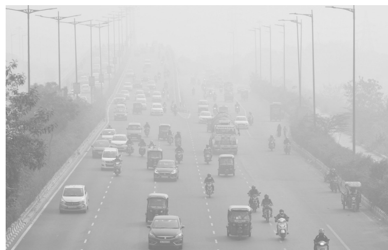
11月9日,人们在雾霾下的新德里出行。印度首都新德里的空气质量近日连续为“严重污染”。这座城市近期新冠疫情出现反弹势头,卫生专家担心空气污染将使患呼吸系统慢性病的人更易感染新冠病毒。