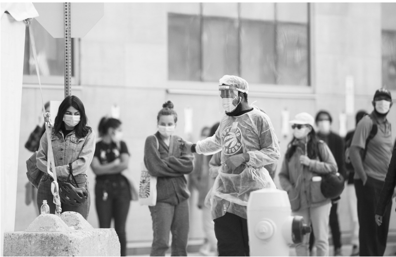
9月17日,在加拿大多伦多一处新冠病毒检测中心外,一名身穿防护服的安保人员维持排队秩序。