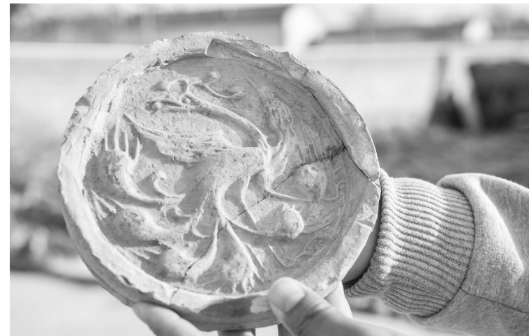
这是在西汉中晚期疑似大型粮仓建筑基址中出土的凤鸟纹瓦当。

近日,内蒙古自治区文物考古研究所与中山大学联合组成的考古队在呼和浩特市玉泉区沙梁子村揭露一处距今约2000年的西汉中晚期疑似大型粮仓建筑基址。