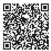
更多精彩 扫码观看

“我省中小企业风险管理和抗压能力普遍较弱,账面现金不足,无法承担高额成本的企业并非少数。提高中小企业融资能力,是帮助其生存下来的有力抓手。”辽宁社科院产业经济研究所所长张天维认为,“化危为机,重新思考产业产品定位,探索转变生产经营方式,对仍然有志搏击市场的企业而言至关重要。”