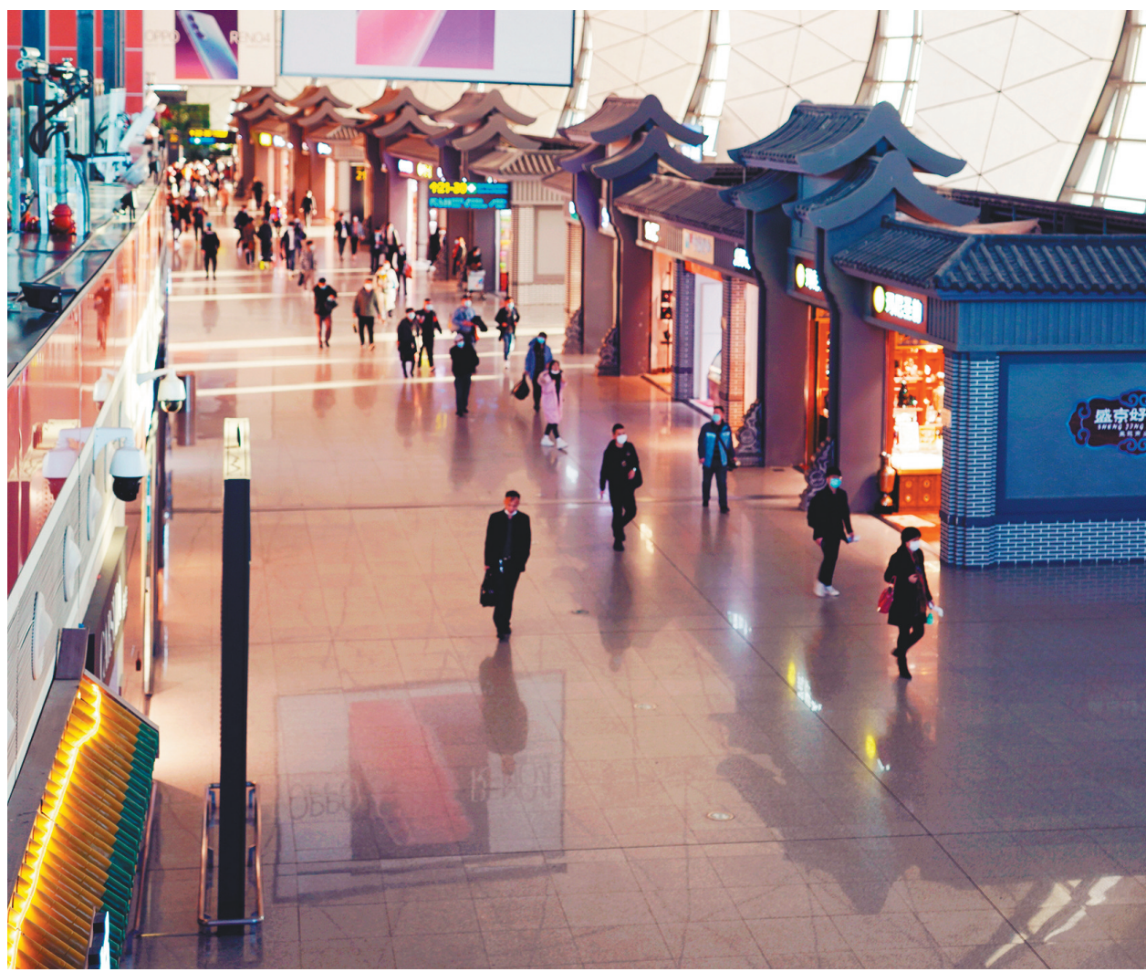
重新活跃起来的机场商业业态。

弓长岭滑雪场的“魅力支撑”,并不偶见。新冠肺炎疫情发生后不久,清华大学经济管理学院商业模式创新调研组,联合北京小微企业综合金融服务有限公司,对北京、江苏、广东等31个省(区、市)的1506家中小企业受新冠肺炎疫情影响的情况及诉求进行了问卷调查。从企业账上现金余额能维持的时间看,1、2、3个月的比例分别为37.05%、31.61%、17.2%,只有8.96%的企业表示可以支撑6个月及以上。