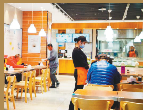
沈阳桃仙国际机场餐饮店内,顾客正在用餐。