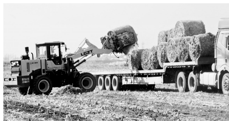
眼下正值秋收收获时节,沈阳市沈北新区在做好水稻抢收的同时,大力推广秸秆回收再利用。图为黄家街道农民把秸秆装车运往发电厂。本报记者 赵敬东 摄