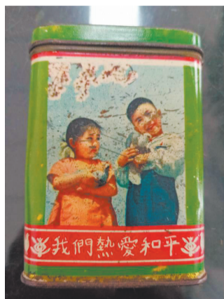
抗美援朝宣传画印在铁盒上。