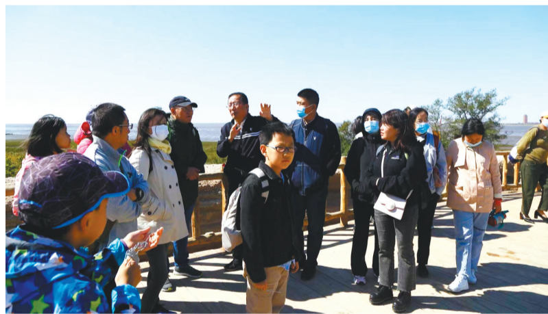
专家在公众考古活动现场做讲解。

公众考古是近年来中国考古学发展最快的分支,而大众对重大考古发现越来越高的关注度,社会各界对文化遗产保护的热情也促进了公众考古的创新。自2014年以来,沈阳市文物考古部门先后举办了“考古现场零距离”“沈阳早期人类探秘之旅”“盛京往事 梦回汗宫”等多场公众考古主题活动。2020年度辽宁·沈阳公众考古活动由省文化和旅游局、沈阳市文化旅游和广播电视局主办,沈阳博物院(沈阳故宫博物院)承办,沈阳市文物考古研究所、沈阳新乐遗址博物馆协办。活动由启动仪式及拓印和模拟探方体验、“拓印历史 传承文脉——云课堂”“维沈之阳 福地呈祥”沈阳考古成果巡展及“走近考古现场——云考古”等四个部分组成。通过网络直播平台现场直播,公众在“云”上一同见证考古人组织的各项公众考古活动。