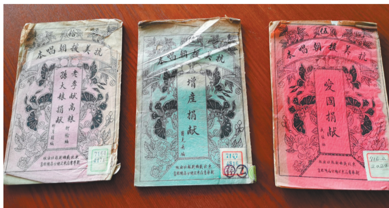
抗美援朝宣传唱本。

由辽宁省文化演艺集团(辽宁省公共文化服务中心)主办,辽宁省图书馆(辽宁省古籍保护中心)、辽宁省图书馆学会承办,辽宁文化艺术工程中心、丹东市图书馆协办的“纪念中国人民志愿军抗美援朝出国作战70周年图片文献展”正在省图书馆展出。展览以图片资料、文献、实物、模拟场景和多媒体影像相结合的形式展出。此展令人关注的是省图书馆充分挖掘馆藏文献资源,真实再现抗美援朝战争历程,弘扬伟大的抗美援朝精神。