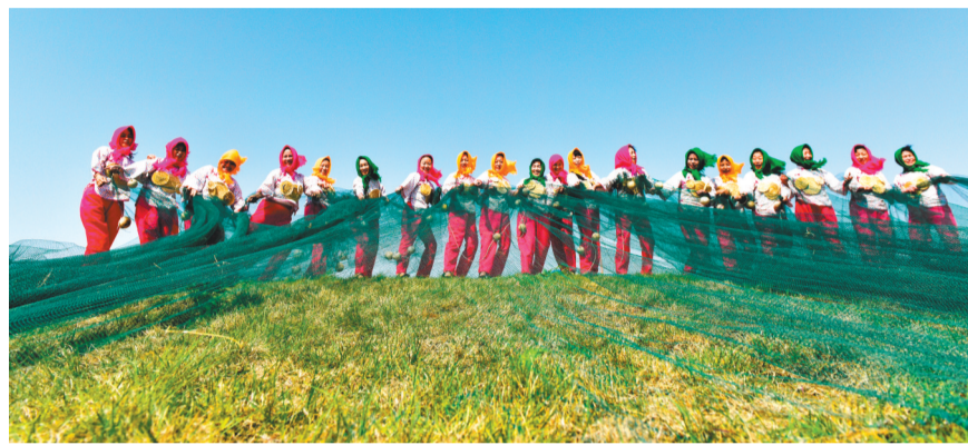
于兴军的摄影作品《丰收》。