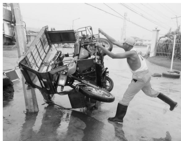
上图:11月1日,在菲律宾蒂加翁,一棵大树被台风刮倒,阻断道路。下左图:11月2日,人们在菲律宾马尼拉的一个临时避难所吃早餐。下右图:11月1日,在菲律宾德奥坎波,一名男子扶住快被风刮倒的三轮车。菲律宾官方2日说,今年第19号台风“天鹅”已造成该国至少16人死亡、3人失踪,菲北部已有约一百万居民被疏散。目前“天鹅”已基本结束对菲律宾的影响。菲律宾国家减灾管理委员会主席里卡多·杰拉德说,死者主要集中在受灾严重的吕宋岛南部地区,目前相关部门正在全力救灾并搜寻失踪人员。