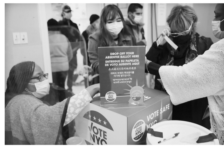
11月1日,选民在美国纽约一个投票站参加提前投票。当日,为期9天的纽约州2020年美国大选提前投票结束。