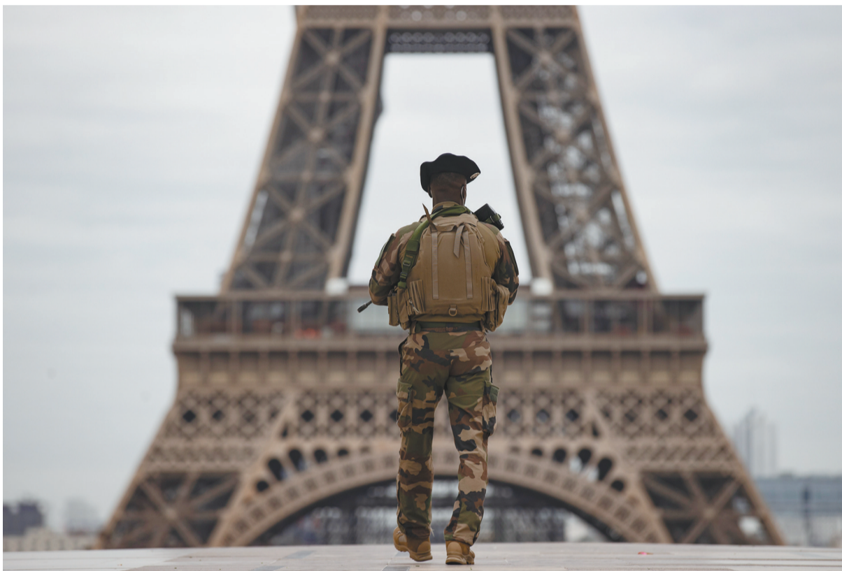
上图:10月30日,在法国巴黎,一名军人在埃菲尔铁塔附近的特罗卡德罗广场巡逻。