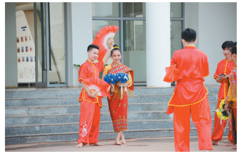
10月30日,在老挝万象,老挝国立大学学生练习中国舞蹈。老挝国立大学孔子学院10月30日举办“孔子学院日”活动,庆祝老挝国立大学孔子学院成立10周年。