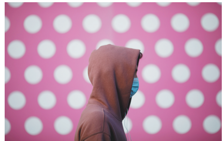
10月30日,在美国首都华盛顿,一名行人戴着口罩出行。美国约翰斯·霍普金斯大学10月30日发布的新冠疫情最新统计数据,美国累计确诊病例超过900万例。