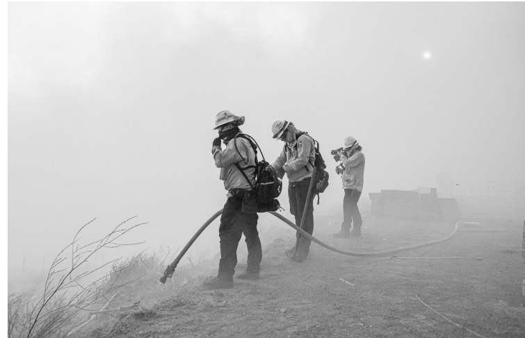
10月26日,消防员在美国加利福尼亚州约巴林达灭火。美国加利福尼亚州日前发生山火,目前已造成约6万居民撤离。