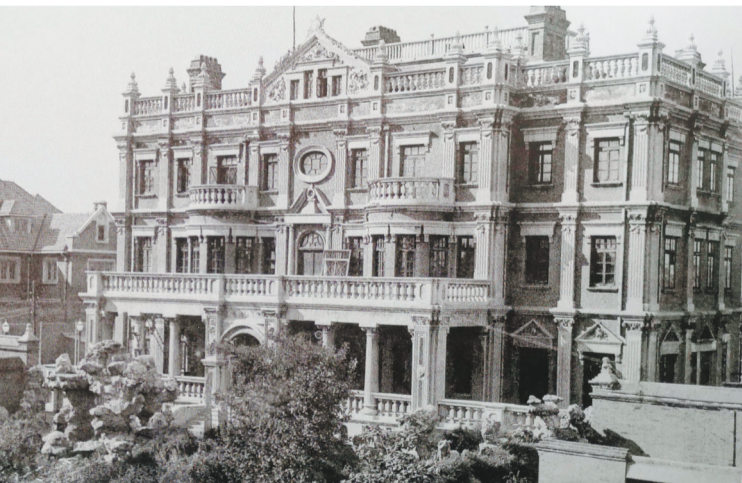
1928年,张氏帅府大青楼。