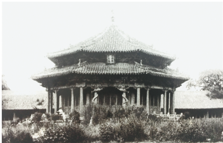
1901年,沈阳故宫大政殿。

1961年,国务院将沈阳故宫确定为国家第一批全国重点文物保护单位。2004年,沈阳故宫列入“世界遗产名录”,成为世界文化遗产。1981年,正式定名沈阳故宫博物院。2017年,沈阳故宫博物院成功晋级国家一级博物馆。