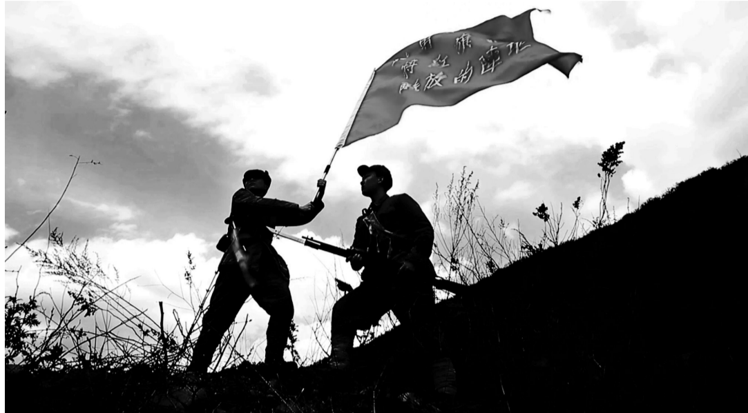
文献纪录片《不朽的丰碑——中国人民志愿军英烈故事集》剧照。