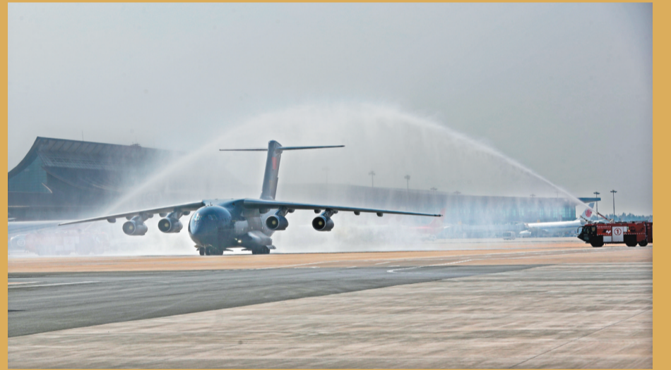
在沈阳桃仙国际机场,运送志愿军烈士遗骸的空军专机通过水门。