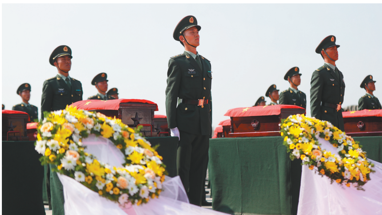
礼兵将殓放志愿军烈士遗骸的棺椁从专机上护送至棺椁摆放区。