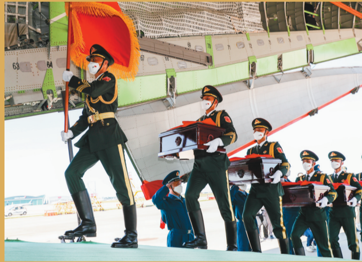
中方礼兵护送志愿军烈士遗骸上飞机。