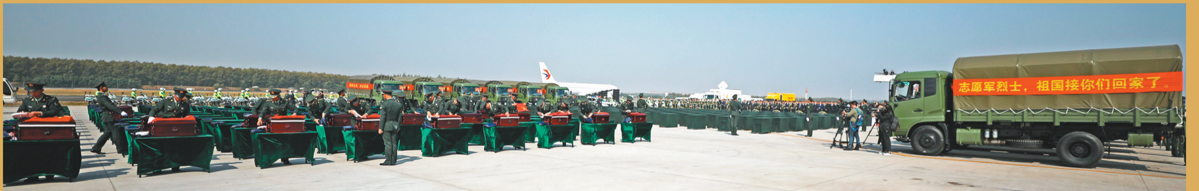
在沈阳桃仙国际机场,礼兵在殓放志愿军烈士遗骸的棺椁上盖上国旗。