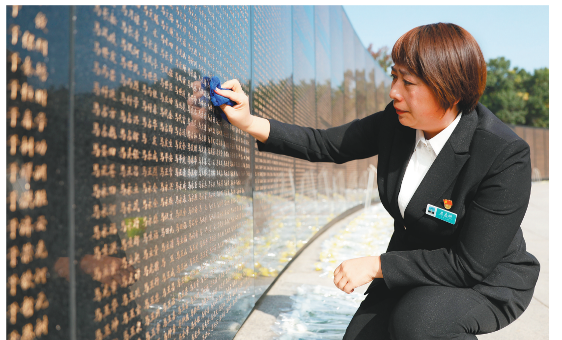
沈阳抗美援朝烈士陵园工作人员在擦拭烈士英名墙。