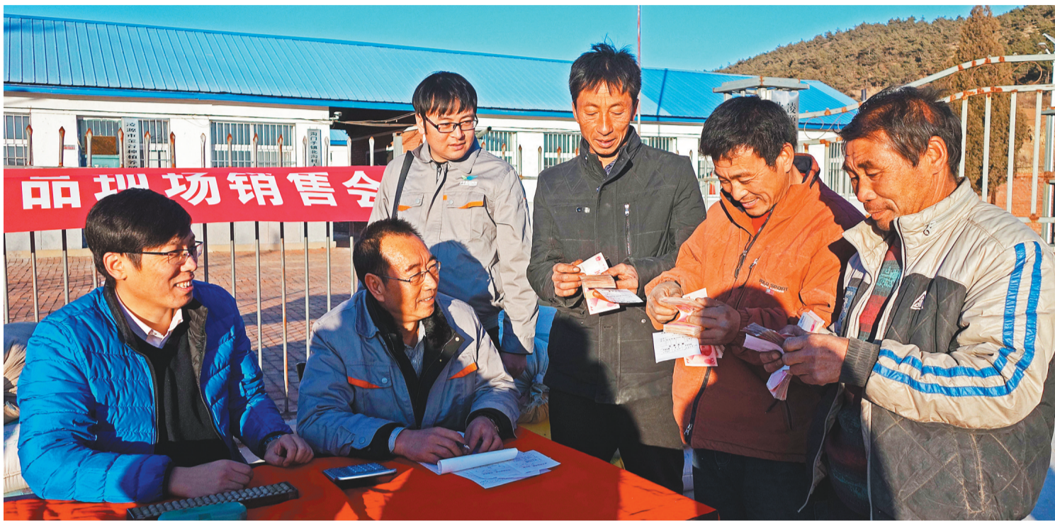
建行辽宁省分行驻村“第一书记”在沟门子镇北沟村为贫困户发放扶贫产业项目分红。

2020年是决战决胜脱贫攻坚收官之年,也是全面建成小康社会收官之年。近年来,建行辽宁省分行持续加强扶贫队伍和机制建设,不断探索创新扶贫模式,丰富扶贫产品与服务,打出精准扶贫“组合拳”,使源源不断的金融“活水”流向地头田间。