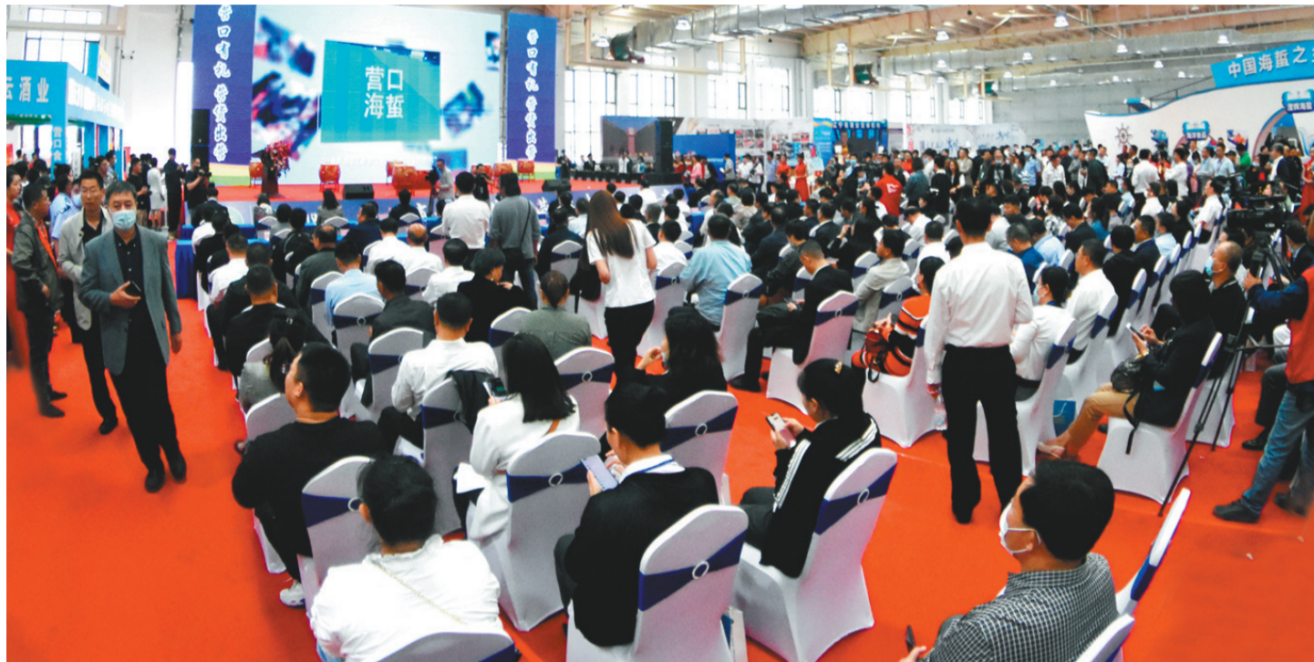
2020中国(营口)海蜇节开幕现场。