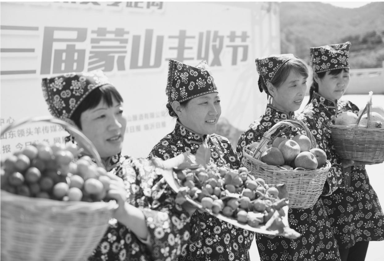
9月20日,在山东省临沂市沂蒙山云蒙景区丰收节活动现场,当地农民展示农产品。当日,山东省临沂市沂蒙山云蒙景区举行“丰收蒙山”丰收节庆祝活动,当地农民与游客一同参与,体验丰收的喜悦。

今年夏粮增产、早稻增产,粮食产量的“大头”秋粮也丰收在望。这是上下同心、努力加实力的结果——“越是面对风险挑战,越要稳住农