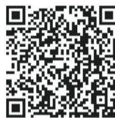
更多精彩 扫码观看