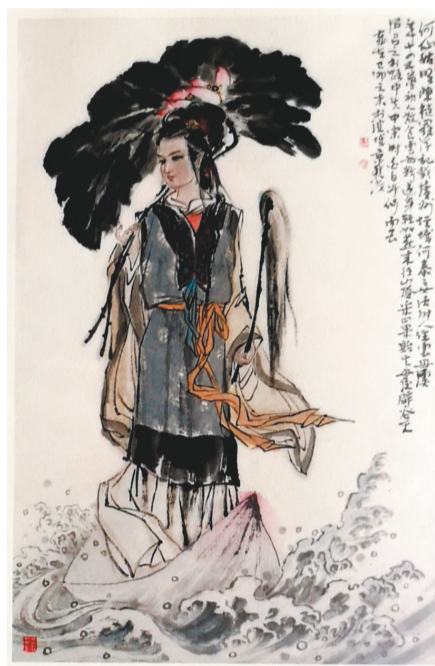
连环画《八仙过海》中的何仙姑。

当代著名书法家王荐认为,临《韭花帖》之难就在于其细致精凝的用笔,杨凝式将点画细部刻画得丝丝入扣,无懈可击,深得“二王”精髓。行笔或轻或重,或将笔毫猛然下压或迅速提起,笔势迅疾。起笔稍重较为含蓄,顶锋入纸,点画收放自然,力贯点画始末。寥寥数字,顿挫有致,神完气足。《韭花帖》线质凝练细劲,灵动多变,故临习时宜选用锋颖锐度高的兼毫或狼毫,纸张宜用平整、偏熟略湿的纸,蘸墨不宜过多,以中等量为宜。