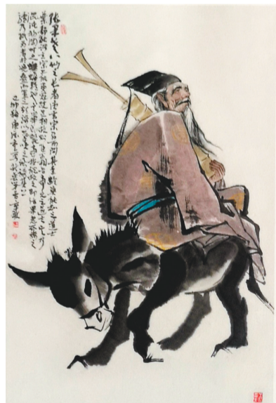
连环画《八仙过海》中的张果老。