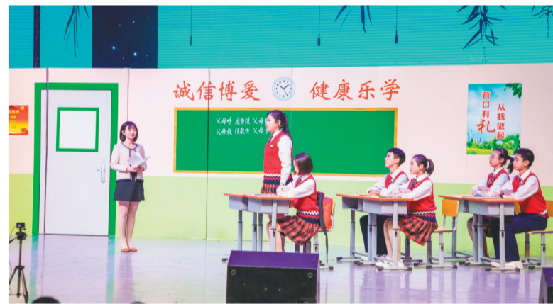
学生们正在进行课堂教学表演。

营口市教育的长足进步,源于近年来市委、市政府对教育工作的高度重视,市委、市政府主要领导对营口市教育的发展给予了持续的关心和关注,关注全市教师队伍建设情况,指导全市教育发展并提出希望,给予鼓励。 市里实施的到教育部直属师范院校“直招”优秀毕业生的做法,不断建强营口市教师队伍,使其整体素质得到全面提升。截至目前,仅省实验中学营口分校就从东北师大等部属高校招聘高层次教师33人。 为解决师资力量不足等问题,从2017年起,营口市加大了教育改革力度。 改革教师招聘方式。施行高层次人才引入新模式,从源头上提高教师队伍的整体素质。2017年以来,营口市共为全地区高中招聘优秀毕业生207人,初步解决了县区普通高中教师队伍层次偏低、招聘渠道不畅的问题,缓解了教师结构性短缺问题。 改革教师管理方式,市直学校