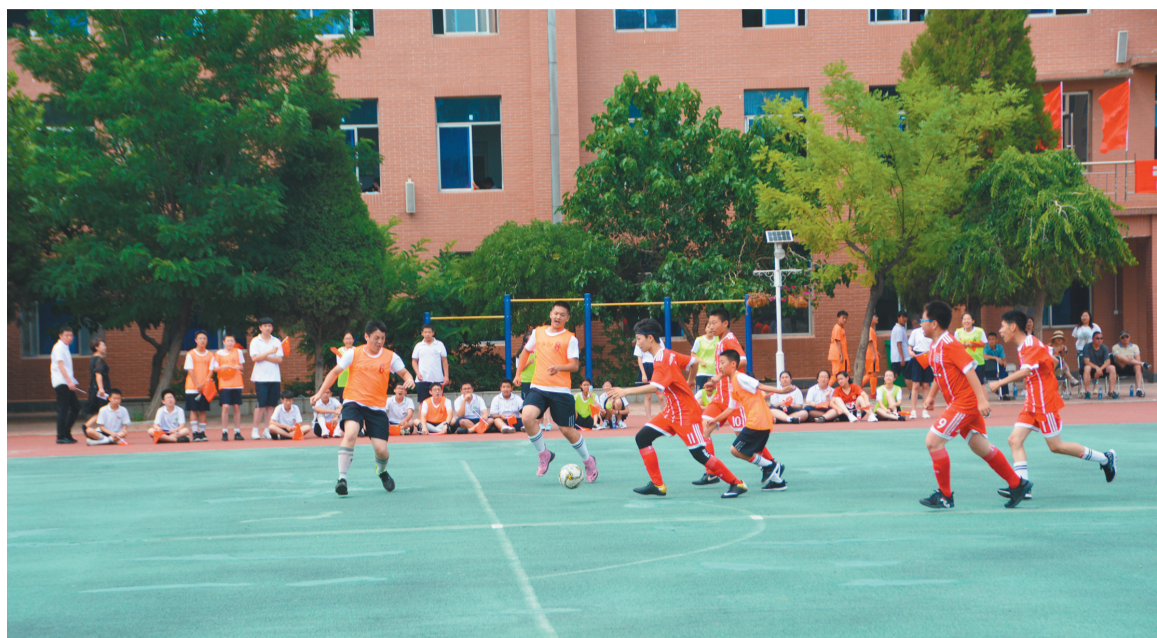
营口市实验中学的体育课上,学生分为两组开展足球训练。

在政策、资源、财力、建设上优先保障教育,强化师德,整治行风,不断扩大优质教育资源供给,打造教育新生态,让营口市教育的社会满意度持续提升,民众获得感明显增强。而营口市教育系统新近提出的树立全程教育观理念,即把高中阶段对学生综合素质评价中各方面能力的培养前置到小学和初中,更是让许多在校生的家长感到满意和放心。