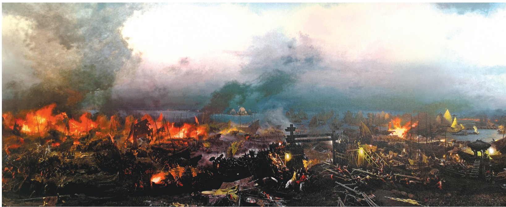
全景画《赤壁之战》局部。

鲁艺在延安初创时期,曾开创出一条用墙报、宣传画、漫画和版面面向大众的文艺新路;东北鲁艺时期又组成文化工作队下乡、下厂、下部队,承接了艺术服务人民的传统。如今,文化艺术空前繁荣的新时代,艺术家能否找到自身与民众需求的契合点,能否走出书斋和沙龙做些让高雅艺术走向民众的实实在在的努力,也是时代赋予的重任。鲁艺没有割断历史,也没有忘却鲁艺精神,以全景画这一高雅的油画艺术作为综合载体,推展普及到大江南北,成为群众赏心悦目的文化需求品。