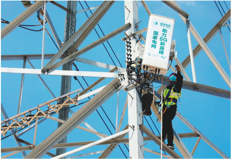
电力工人对输电杆塔上的通信基站设备进行调试。

本报讯 记者刘大毅报道 日前，依托沈阳220千伏蒲大线103号输电杆塔实施的通信基站融合项目完成设备安装调试，正式为京沈高铁乘客提供更加稳定和便捷的5G移动通信信号。